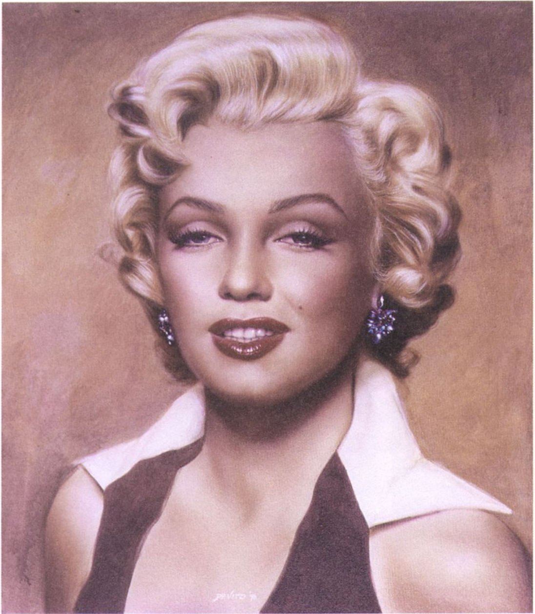
Marilyn Monroe Acryl auf Leinwand 50 x 60 cm